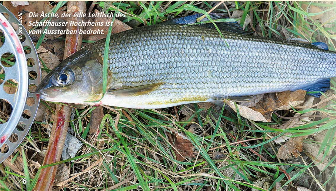
Die Äsche, der edle Leitfisch des Schaffhauser Hochrheins ist vom Aussterben bedroht.

Die – nach Kraftwerken und Kormoranen– dritte Gefahr wurde im Hitzesommer 2003 akut: Bei Wassertemperaturen von über 26 Grad starben innert wenigen Tagen etwa 50 000 Äschen, etwa 97 % des Bestandes. Nach vier Jahren Fangverbot konnten die Schonmassnahmen behutsam gelockert werden; der Bestand erholte sich erfreulich, wurde aber durch den erneuten Hitzesommer 2018 wieder zunichte gemacht. Diesmal wurde fast der gesamte Äschenbestand vernichtet. Das Fischen auf Äschen wurde eingestellt, der Bestand hat sich aber leider bisher nicht erholt. Die Klimaveränderung und die Kormorane, die oberhalb von Diessenhofen nicht mehr bejagt werden dürfen, lassen für die Zukunft wenig Hoffnung für das Überleben der Äsche am Hochrhein.